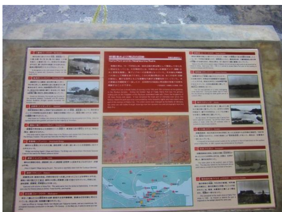
なほこうしゅうへん きゅうせき ⑨那覇港周辺の旧跡