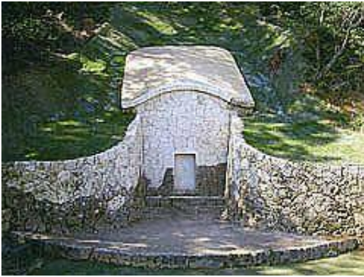
たまぐすくちょうくん はか へんとな はか ⑱玉城朝薫の墓 (邊土名家の墓)