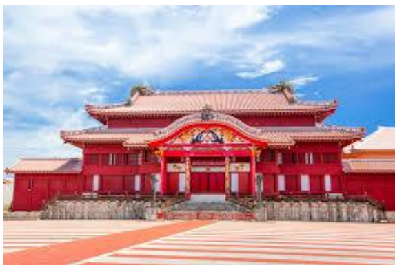
しゅりじょうあと ⑬首里城跡