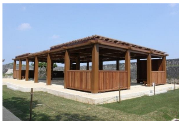
しゅりじょう ぜにくらあと ⑱首里城 銭蔵跡