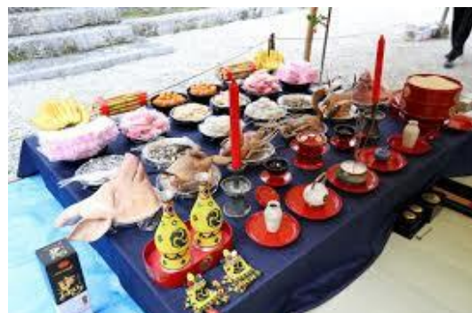
しーみーさい ⑫清明祭のウサンミ (お供え物)