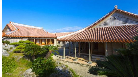
しゅりじょうしょいん さすのまていえん ⑳首里城書院・鎖之間庭園