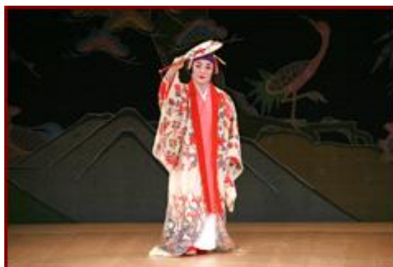
りゅうきゅうぶよう ⑯琉球舞踊