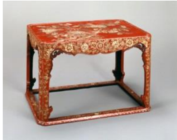
㉒朱漆牡丹尾長鳥螺鈿卓 (琉球漆器)