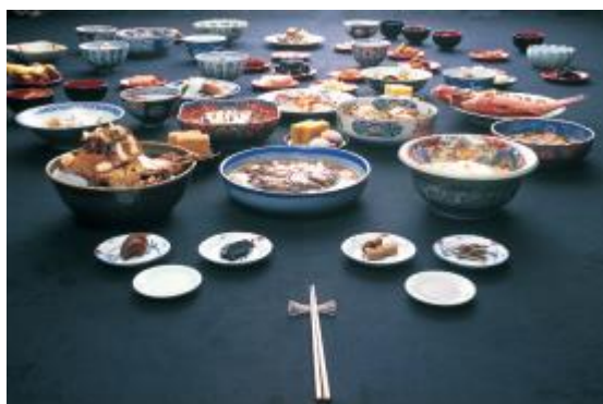
うかんしんりょうり ふくげん ⑮御冠船料理の復元