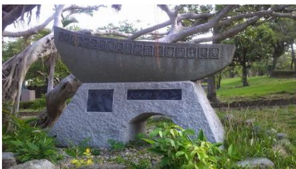
くめむら600ねんきねんひ ⑪久米村600年記念碑