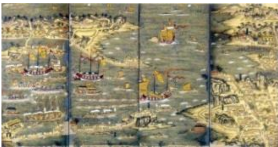
㉓琉球交易港図屏風