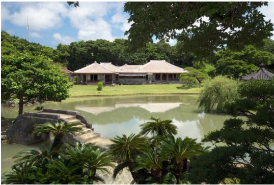
しきなえん ㉑識名園