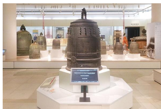
きゅうしゅりじょうせいでんしょう ばんこくしんりょう かね ⑥旧首里城正殿鐘（万国津梁の鐘）