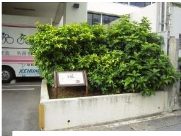
てんしかんあと ⑦天使館跡