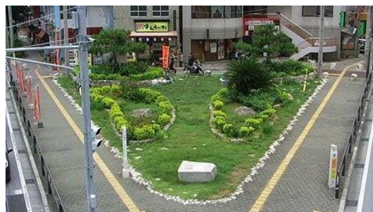
⑧久米村周辺の史跡・旧跡