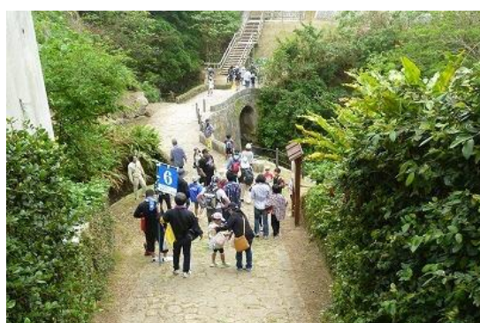
⑤歴史ロマン街道「尚寧王の道」を訪ねて（文化の日イベント）