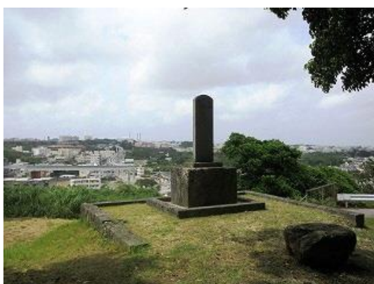
③浦添グスクの前の碑