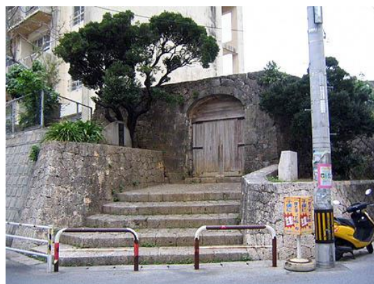
かみてんびぐうあと いしもん ⑩上天妃宮跡の石門