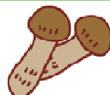
まつたけ Matsutake mushroom